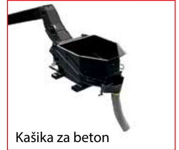
Kašika za beton