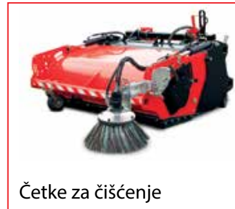
Četke za čišćenje