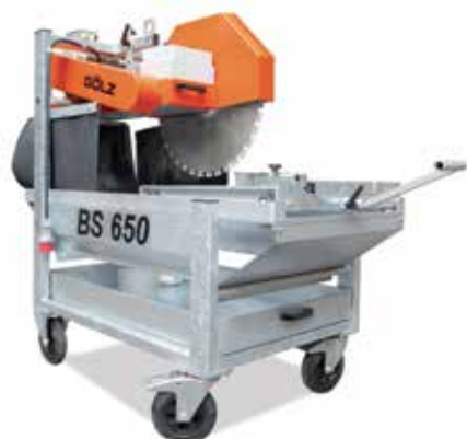
Rezni sto BS650