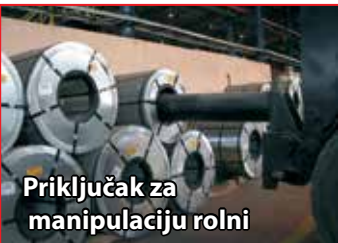
Priključak za manipulaciju rolni