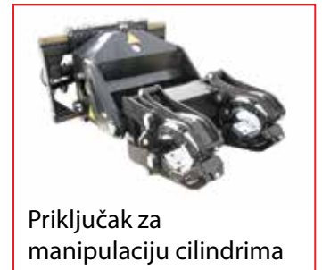
Priključak za manipulaciju cilindrima