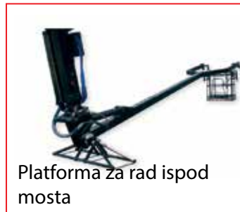
Platforma za rad ispod mosta