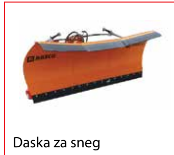
Daska za sneg