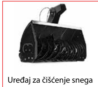
Uređaj za čišćenje snega