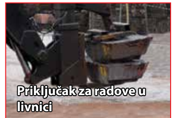
Priključak za radove u livnici