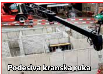
Podesiva kranska ruka