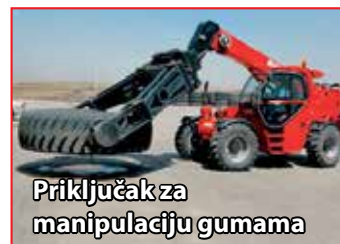
Priključak za manipulaciju gumama