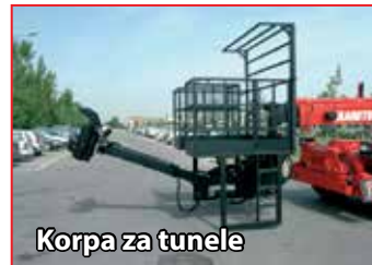
Korpa za tunele