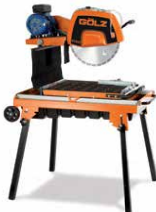
Rezni sto BS400