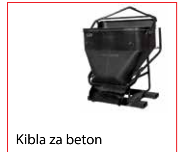
Kibla za beton