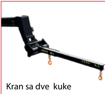
Kran sa dve kuke