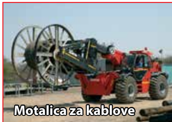
Motalica za kablove