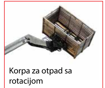
Korpa za otpad sa rotacijom