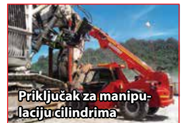
Priključak za manipulaciju cilindrima