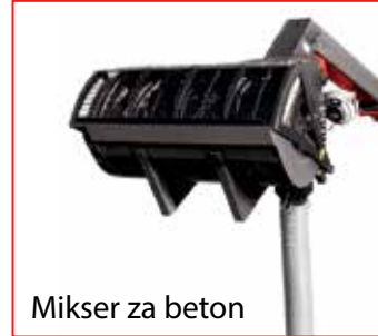
Mikser za beton