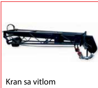
Kran sa vitlom