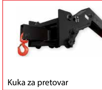
Kuka za pretovar