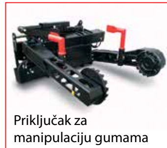
Priključak za manipulaciju gumama